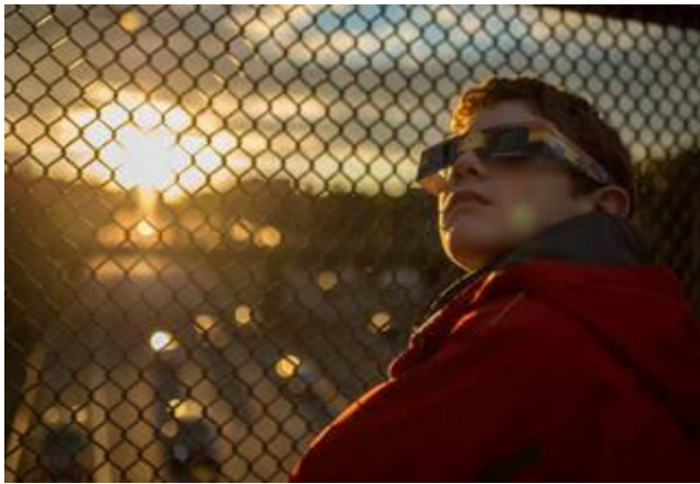
Un niño que lleva anteojos con protección de la vista observa un eclipse solar parcial desde Arlington, Virginia, en 2014.

Nunca es seguro mirar directamente los rayos del sol, incluso si el sol está parcialmente oscurecido. Cuando observe un eclipse parcial debe usar anteojos para eclipses en todo momento si desea estar de frente al sol, o debe utilizar un método indirecto alternativo. Esto también se aplica durante un eclipse total hasta el momento en el que el sol esté completa y totalmente bloqueado.