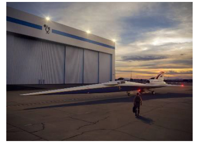
Concepto artístico del demostrador de vuelo de pluma baja fuera del hangar Skunk Works de Lockheed Martin Aeronautics Company en Palmdale, California.