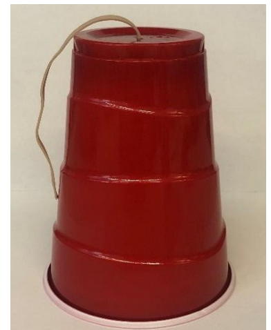
Ejemplo del amplificador del paso 4

Para ver videos relacionados con el sonido y el X-59, visite: